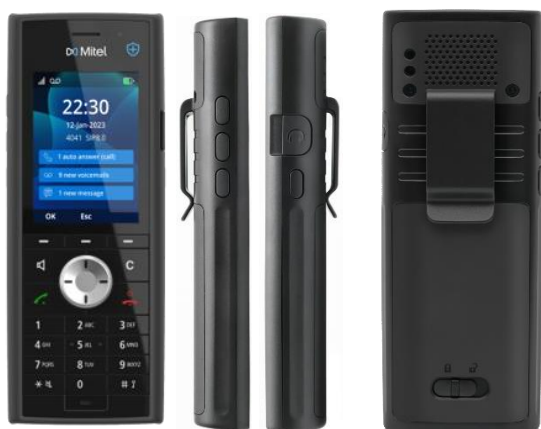
*Mitel 722dt DECT-Mobilteil

Die Funktions- und Firmware-Updates halten die Mobilteile Over-the-Air auf dem neuesten Stand. Die neue 700d DECT-Serie arbeitet mit den bestehenden 600d DECT-Mobilteilen und Mitel SIP DECT-Basisstationen zusammen, da sie die gleichen RFPs haben. Nutzen Sie Ihre bestehenden Investitionen in die Mitel-Infrastruktur – Sie müssen sie nicht ständig ersetzen.